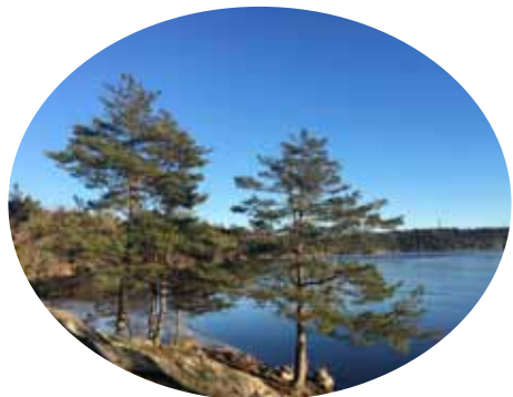
Tyresö Flaten.

http://www.tyreso.se/Se-och-gora/Friluftsliv-och-natur/Bat-kanot-kajak/