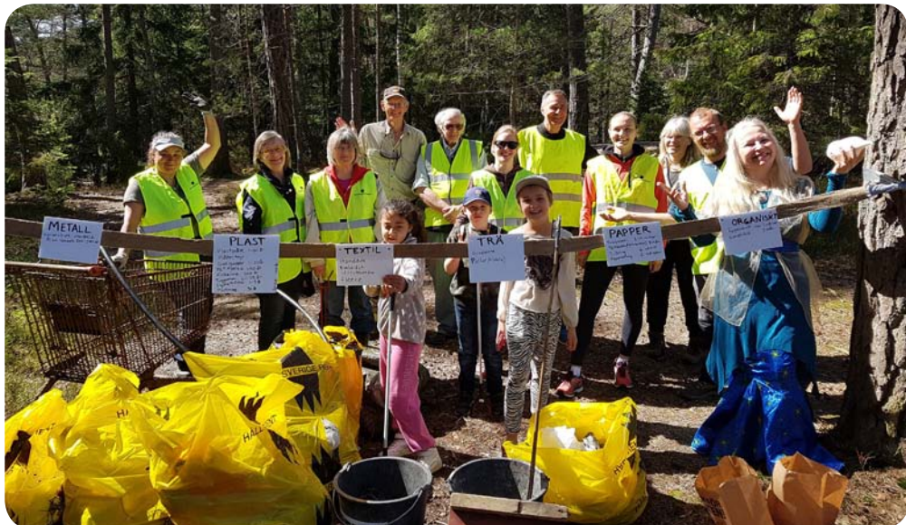
Tolv säckar skräp plockades upp av oss 2018!