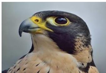
Pilgrimsfalken, som har mycket skarp syn och ser längre än de flesta, var utrotningshotad men räddades genom Naturskyddsföreningens arbete och är därför vår symbolfågel.

... önskar sig en mer offensiv strategi för solel i kommunens planer.