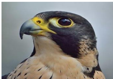
Pilgrimsfalken, som har mycket skarp syn och ser längre än de flesta, var utrotningshotad men räddades genom Naturskyddsföreningens arbete och är därför vår symbolfågel.