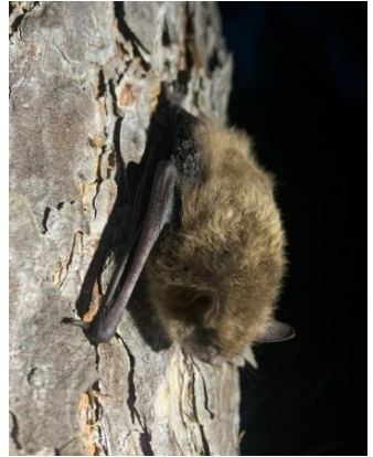
Trollpipistrell. I Tyresö kommun har den endast registrerats i Amaryllisparken.

Anmälan: OBS begränsat antal! Mejla anmälan till tyreso@naturskyddsforeningen.se. Exkursionen ställs in vid regn.