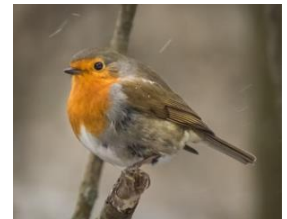
Rödhake.